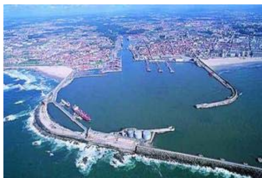
En el centro de la imagen, zona del puerto de Leixões –Oporto– donde se ubicará su Campus do Mar.

En la Universidad de Minho, con sede en Braga, el rector vigués también mantuvo reuniones interesantes que podrían desembocar en un apoyo al Campus del Mar. Este viernes le toca el turno a Aveiro, para concluir el ciclo de visitas a los centros universitarios del norte de Portugal. "Tenemos muchos frentes abiertos", valora el coordinador del macroproyecto del campus de excelencia.