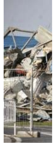
La antigua nave de cableros y el Concello

Advierten de que paralizar otra obra más supone poner en serio peligro la competitividad del puerto