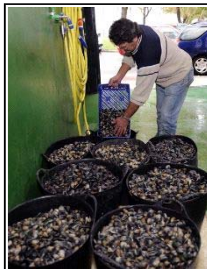
Imaxe dunha xornada da pasada campaña de Nadal d.a.

Os tres pósitos puideron mariscar na ría de Ferrol durante catro meses, como vén sendo habitual dende a posta en marcha por parte da Xunta do plan de dinamización para esta actividade, trala declaración do banco das Pías como zona C polo elevado nivel de contaminación. A campaña na que se sumaron máis vendas foi a de Nadal, que se desenvolveu ó longo do mes de decembro.